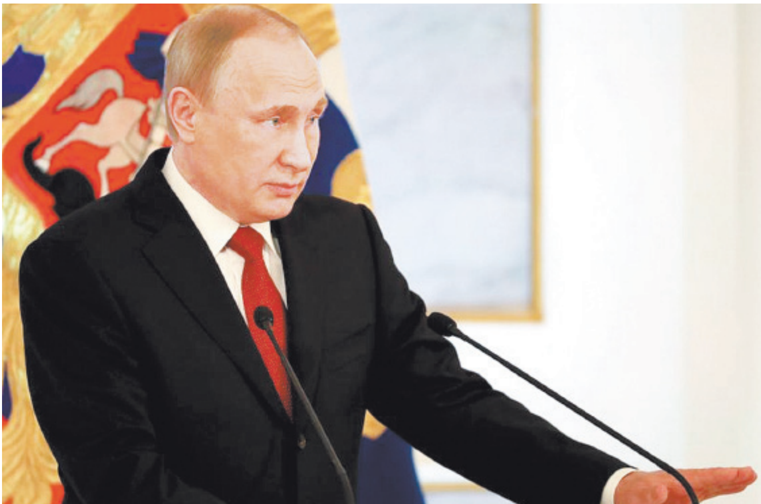
В ежегодном Послании президента России Владимира Путина Федеральному Собранию затронуты актуальные вопросы сегодняшнего дня

1 ДЕКАБРЯ ПРЕЗИДЕНТ РОССИИ ВЛАДИМИР ПУТИН ОБРАТИЛСЯ С ЕЖЕГОДНЫМ ПОСЛАНИЕМ К ФЕДЕРАЛЬНОМУ СОБРАНИЮ РОССИЙСКОЙ ФЕДЕРАЦИИ.