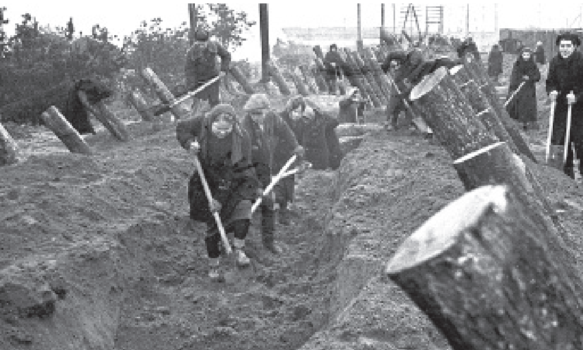
И подростки, и взрослые осенью 1941 года рыли окопы, защищая подступы к Москве

«Ещё четыре военных месяца мы работали на за- воде, делали противотанковые мины. Нас было не- сколько подростков, мы трудились полную смену по 12 часов, неделю утром, неделю в ночь, единственное,