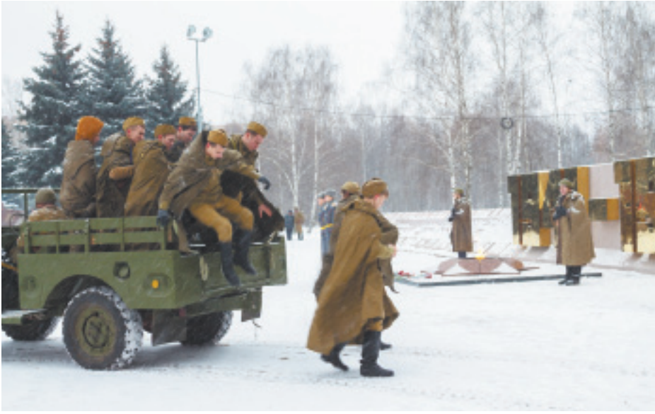
Фрагмент исторической реконструкции

А к мемориалу Славы почтить память погибших и отдать дань уважения ветеранам, прошедшим тот знаменательный бой, пришли ученики близлежащих