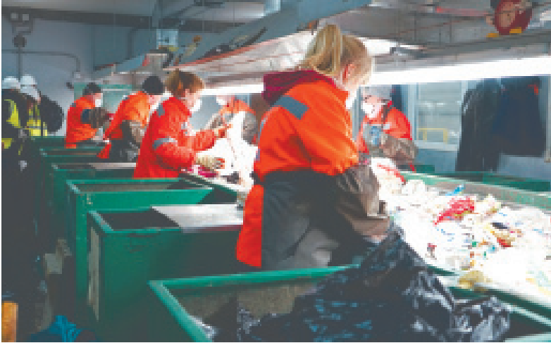
На современных полигонах сортируют отходы

Министр экологии и природопользования Московской области Александр Коган отметил, что в Подмосковье вместо 39 экологически опасных полигонов (по состоянию на 2013 год) в 2019 году появятся 11 современных высокотехнологичных комплексов по утилизации