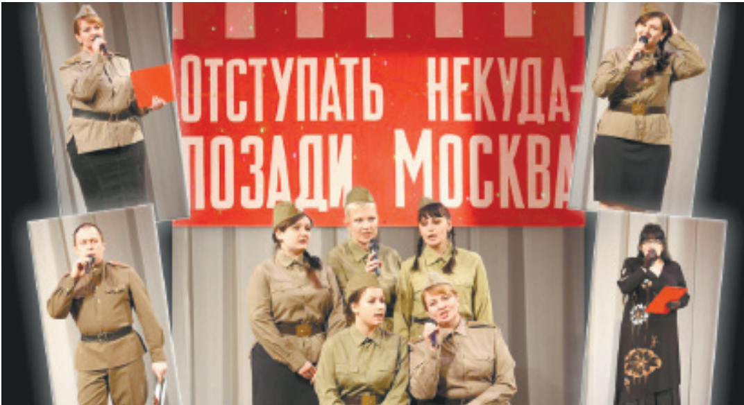
Концерт творческих коллективов ДК погрузил зрителей в атмосферу военного времени

5 ДЕКАБРЯ В ДК «ТЕКСТИЛЬЩИК» ПРОШЁЛ ТЕМАТИЧЕСКИЙ ВЕЧЕР, ПОСВЯЩЕННЫЙ 75-ЛЕТИЮ БИТВЫ ПОД МОСКВОЙ.