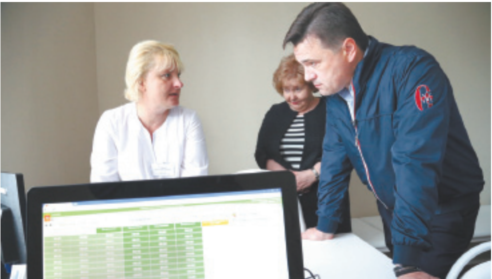
Андрей Воробьёв поставил задачу – в будущем году завершить программу модернизации здравоохранения

Губернатор обратил внимание на важность активной социальной коммуникации. Он отметил, что необходимо вести постоянный диалог с общественными структурами, особенно, когда речь идёт о благоустройстве, ремонте дорог, модернизации ЖКХ и других проблемах, которые напрямую касаются жителей.