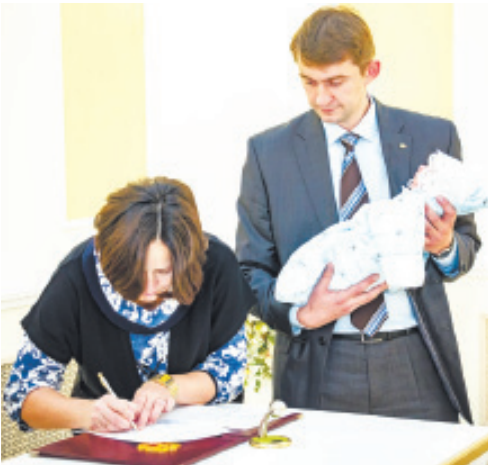
Регистрация нового жителя Королёва

Произведена государственная регистрация 2726 новорождённых, из них мальчиков – 1397, девочек – 1332. Причём 1254 новорождённых стали первенцами в своих семьях, вторых детей родилось 1039, третьих – 337. Также зарегистрировано 29 двоен. Наиболее часто дети рождались у родителей в возрасте от 26 до 30 лет. В списке самых популярных имён мальчиков значатся Александр, Артём, Максим, девочек – Анна, Мария, Виктория. Количество зарегистрированных браков составило 1432. Из них 262 брака зарегистрировано с участием иностранных граждан, из них 247 – с гражданами стран СНГ и Балтии (лидеры – Украина, Молдова, Армения), 15 браков с гражданами дальнего зарубежья: Афганистана, Бангладеша, Боснии и Герцеговины,