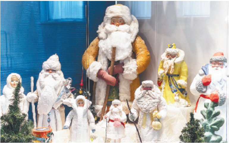
В музее ёлочных украшений

на колючую ветку? Или шарик «прожектор», передававшийся в семье из поколения в поколение... Долгожданным новогодним чудом для нас стало именно это возвращение в собственное детство, куда мы увлекли и своих сына и дочь, никогда не видевших игрушек из ваты и стеклянных початков кукурузы. В выставочном комплексе «Клинское Подворье» можно как следует разглядеть целые тематические коллекции: фрукты-овощи, зверушки, спортсмены и – что особенно заинтересует жителей наукограда! – игрушки космической эры. Фигурки покорителей звёздного пространства, ракеты и небесные тела очаруют даже того, кто чужд космической романтики. Впрочем, в Королёве таких, наверное, нет... А уж новогодние фантазии близки каждому, даже самому серьёзному и взрослому человеку! Впрочем, тот, кто жить не может без исторических подробностей и точных фактов, тоже останется доволен, ведь экскурсоводы здесь замечательные. Путешествуя по двенадцати залам, мы узнали о зарождении и развитии стекольного промысла на клинской земле; увидели, как выглядела изба мастера-стеклодува, ремеслом которого обычно была занята вся семья; выяснили, как в русских домах появились рождественские, а затем новогодние ёлки... Вы знаете, к примеру, что такое проволоочная канитель? Я увидела её впервые. Но не буду передавать вам всё, услышанное в этом сказочном музее, чтобы