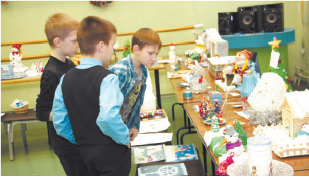
На выставке «Снежные кружева»