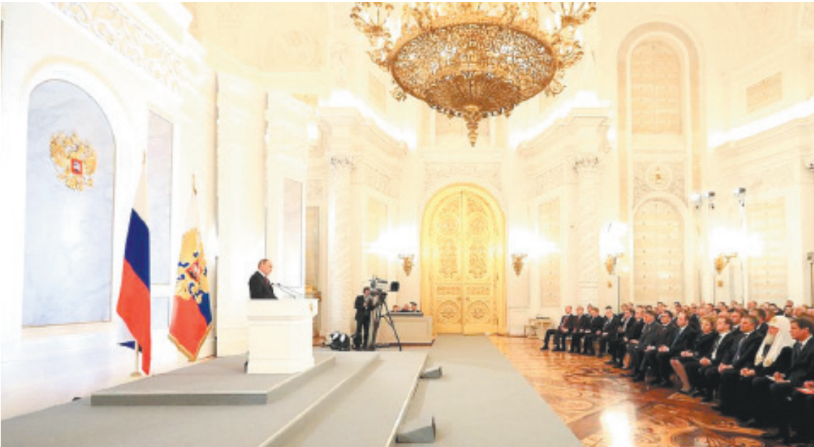
Более 1000 человек присутствовали на мероприятии в Кремле

– В основе всей нашей системы образования должен лежать фундаментальный принцип: каждый ребёнок, подросток одарён, способен преуспеть и в науке, и в творчестве, и в спорте, в профессии и