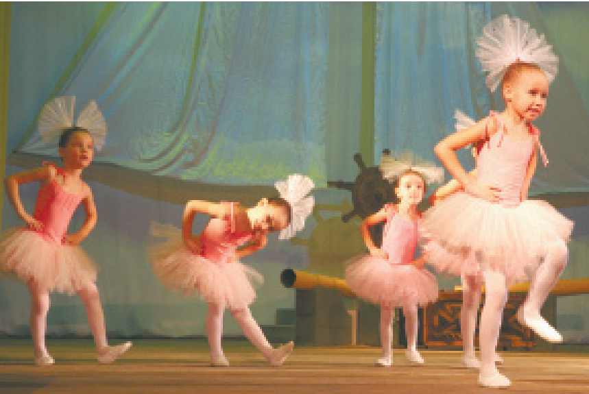
Танцу покорны все возрасты

Лидия Банникова